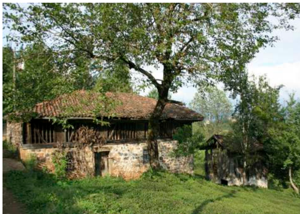
Οικία στο χωριό Κουρίτς