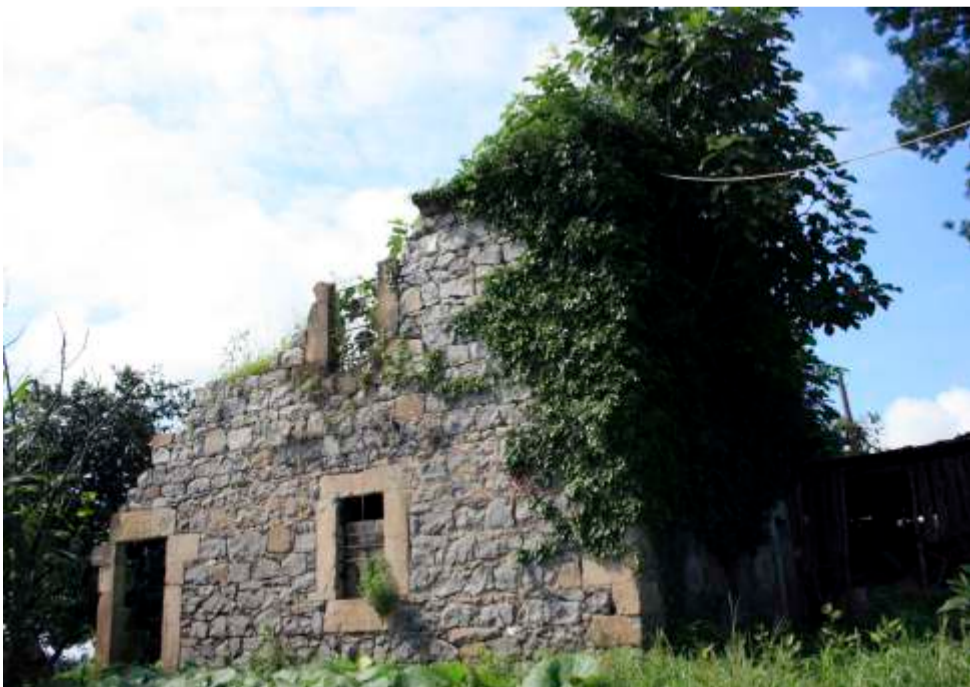
ΚΡΗΝΙΤΑ, Εκκλησία Ταξιαρχών