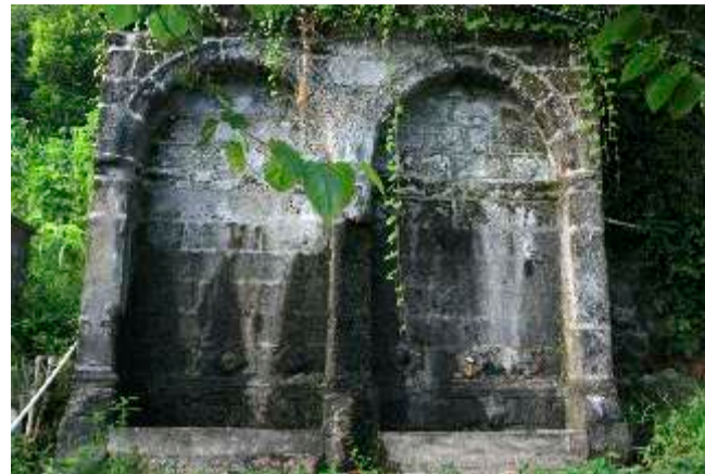
Βρύση στο χωριό Γίγας

χριστιανοί και ούτοι ίδια εν Σουρμένοις και Γημωρά(Γεμουρά), πάντες δε οι άλλοι εν τε τω κρυπτώ και εν τω φανερώ ήσκουν την μουσουλμανικήν θρησκείαν. Εκ τούτων οι μέν Λαζοί και οι κάτοικοι Σουρμένων και Γημωράς(Γεμουράς) απέβαλον μετά της θρησκείας και την γλώσσαν, και υπό την επίδρασιν της μουσουλμανικής θρησκείας ανεφάνησαν εν αυτοίς ο παλαιός άνθρωπος και αι ορμαί και τα ένστικτα των Τζάνων. Οι δε περί τον Ψυχρόν ποταμόν (Μπαλατζή ντερέ) οικούντες Οφίται ή Οφλήδες διέτηρησαν την Ελληνικήν γλώσσαν και τα Ελληνικά έθιμα, ενθυμούνται δε ακόμη την εξ Ελλήνων καταγωγήν αυτών. Είναι ημερώτεροι των Λαζών και κατά την κληροδοθηείσαν αυτοίς υπό των Ελλήνων προγόνων αυτών παράδοσιν ασχολούνται περί τα γράμματα και την θεολογίαν. Αι μουσουλμανικά ιερατικά και θεολογικά σχολαί του Όφεως ήσαν αι τελειότεραι εν τω Οθωμανικώ κράτει. Οι άνδρες εν Όφει γινώσκουσι και την Τουρκικήν γλώσσαν, αλλά αι γυναίκες ηγνούν αυτήν, και δια τούτο μέχρι των ημερών ημών εις την κατ' οίκον ομιλίαν εγίνετο χρήσις του Ελληνικού Ποντικού ιδιώματος του Όφεως. Τα χωρία αυτών μέχρι των ημερών ημών διετήρουν τα Ελληνικά αυτών ονόματα, Παλαχώριν, Μεσοχώριν, Υψηλή ή Υψηλάντων, όθεν προήλθεν η οικογένεια των Υψηλάντων ή Υψηλάντων, Ξένος, Φωτεινός, Χαλάεσσα, Γοργορά, Κοντού, Χωλός, Όκελος, Αληθινός, σΰζονται δεν εν αυτοίς πολλοί ναοί και χειρόγραφα Ελληνικά.